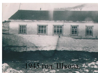
1945 год. Школа.

Школа была трехклассной, в 4-й класс ездили, кто имел возможность, в Елизово. Располагалась в маленьком домике недалеко от берега реки Корякской. Работал один учитель в две смены.