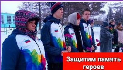
Защитим память героев