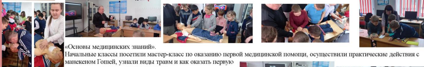
«Основы медицинских знаний».

Прошли и дни безопасности в центре, по направлению