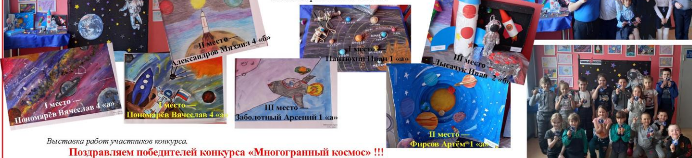
Выставка работ участников конкурса.

12 апреля —отмечался праздник «День космонавтики» 60 лет со дня первого полёта человека в космос , поэтому было решено провести и дни космоса, увлекательные викторины и конкурс «Многогранный космос».